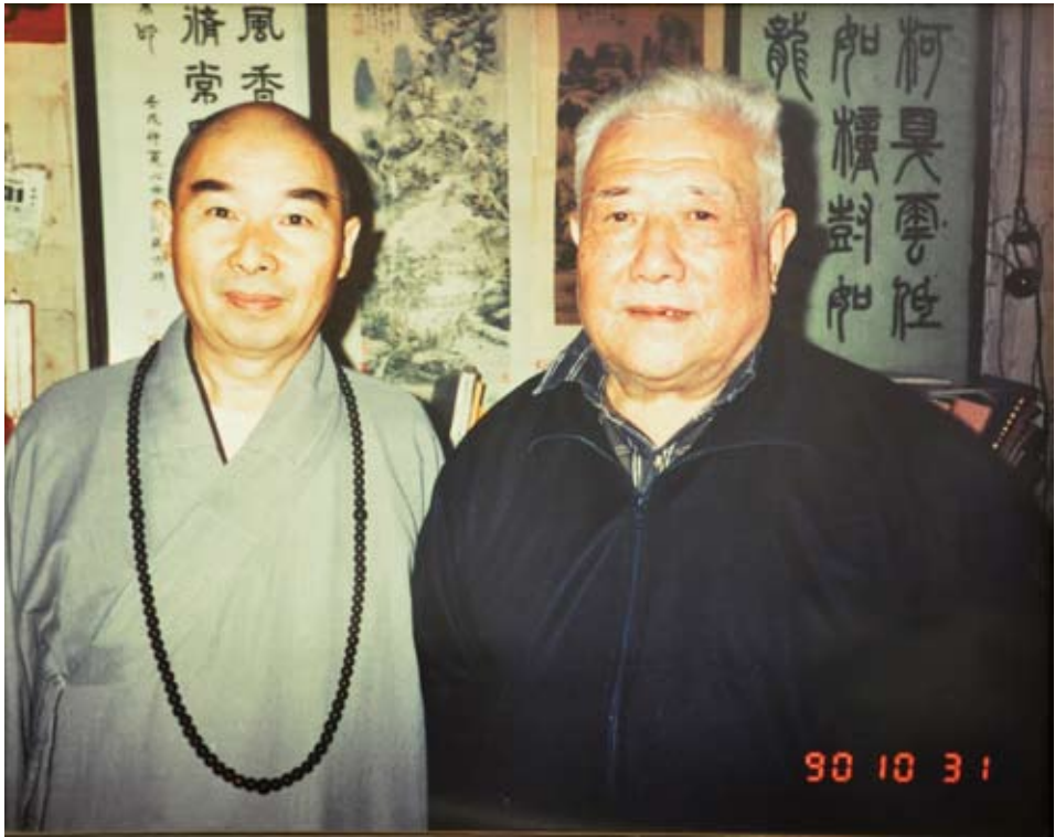
師法老。影合時（右）士居老祖念黃訪探（左）師法老年○九九一 古外中集會，火燈之老夏傳繼，病老懼無人上公念嘆讚及謝感分十 經此。命慧佛續，《經壽量無》解註，部三十九百一疏論、論經今 。典寶有希之度得生眾年千九法末為實註