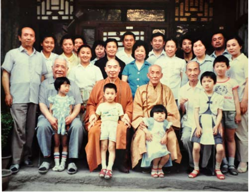
(左) 人上公念與京北問訪 (中) 師法空淨日六十月六年〇九九一 。所寓士居老黃於攝合修同諸暨